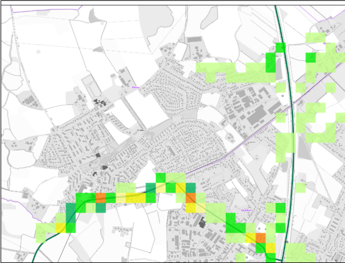
Abbildung 1: Lärmkennziffer Ellerau

Um die belasteten Bereiche in Ellerau detaillierter zu ermitteln, wurden auf Grundlage der im Geoportal Umgebungslärm 21 bereitgestellten Daten der Lärmkartierung des Landes Schleswig-Holstein die Fassadenpunkte an Wohngebäuden ermittelt, die Pegel von >55-60 dB(A) L_{Night} (gelb, grün) und über 60 dB(A) L_{Night} (orange/rot) aufweisen und damit einer hohen bzw. einer sehr hohen nächtlichen Belastung (vgl. Tabelle 3) ausgesetzt sind.