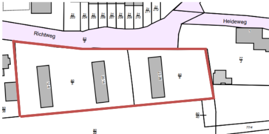
Planskizze zukünftiger Geltungsbereich der 13. Änderung des Bebauungsplanes Nr. 10 (ohne Maßstab)

Die Gemeindevertretung der Gemeinde Ellerau hat in ihrer Sitzung am 14.12.2023 beschlossen, für das Gebiet südlich des Richtweges, östlich der Straße „Vor dem Bahnhof“, nördlich der Bahnstraße, entlang der AKN-Bahngleise die 13. Änderung des Bebauungsplanes Nr. 10 „Ortsmitte“ aufzustellen. Die Lage des Plangebietes ist aus nachfolgender Planskizze ersichtlich.